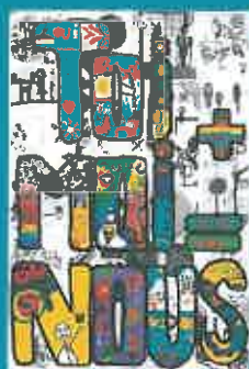
Toi+moi=nous - Affiche lauréate de l'édition 2012 Accueil périscolaire de l'école de Kergoat Ar Lez, 29000 Quimper

Dans cette approche, l'action éducative favorise à la fois la réussite scolaire et l'insertion dans la société. Elle puise sa richesse dans la diversité et dans la qualité des loisirs éducatifs et se développe grâce à un réseau de structures éducatives de proximité : centres de loisirs, multi-accueils, clubs de jeunes.